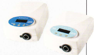
GoodKnight 425 Bi-Level-Serie