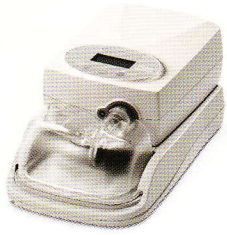
GoodKnight H 2 O ist kompatibel mit: